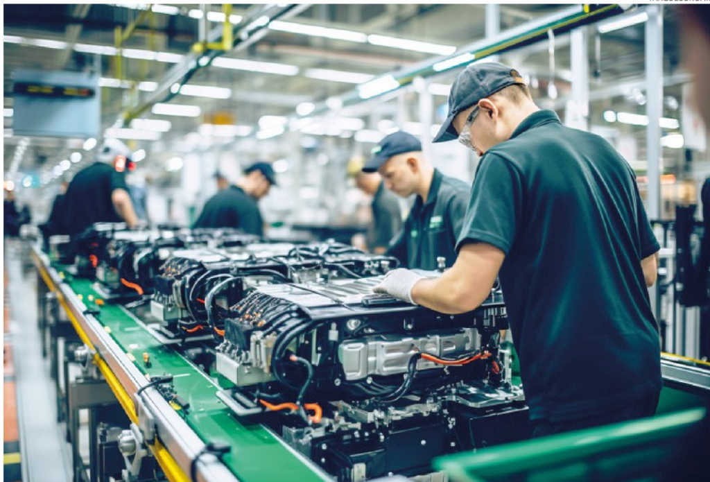
Legge di Bilancio. Gli interventi previsti dal governo risentono delle poche risorse da utilizzare