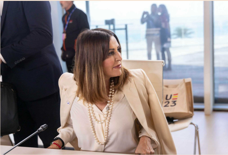
▲ Il ministro del Turismo Daniela Santanchè

Soddisfatta il ministro Santanchè : «Anche l'Italia, finalmente, riduce la soglia economica minima per accedere al servizio, fornendo un'opportunità unica per la promozione del Made in Italy, e, in particolare, per lo sviluppo dell'artigianato locale. Così facendo il governo Meloni intende sostenere la ripresa della filiera del turismo nazionale e potenziare il rilancio a livello internazionale dell'attrattività turistica italiana. La misura, infatti, andrà a generare impatti positivi su tutta la filiera del turismo , aumentando la domanda sull'intero territorio nazionale».