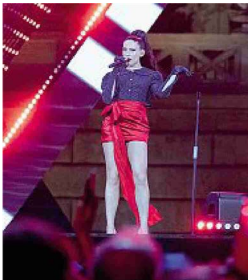
Lo show Angelina Mango e Marco Mengoni sul palco. Qui sopra Ditonellapiaga. Sotto la folla a piazza del Popolo